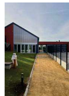
Li Vi Quarem, la nouvelle salle de fêtes de Berloz.

2. L'aménagement de la rue Muselle et de ses trottoirs en 2020, non loin de l'administration de Berloz, est également l'un des accomplissements de ce mandat au travers du plan PIC. « Il s'agit d'une