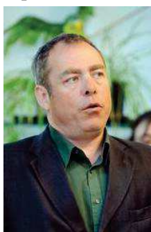
Roland Vanseveren.