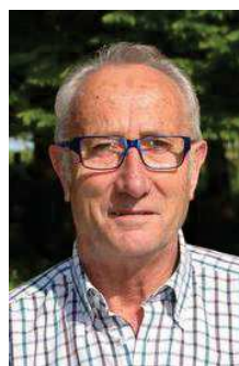
Paul Jeanne.

n'est pas tendre avec la majorité. « Le plan pour les couloirs de boues n'a toujours pas été mis en œuvre et on a perdu les subsides liés au plan POLLEC2020 par exemple. Par contre, on rejoint la majorité sur le projet