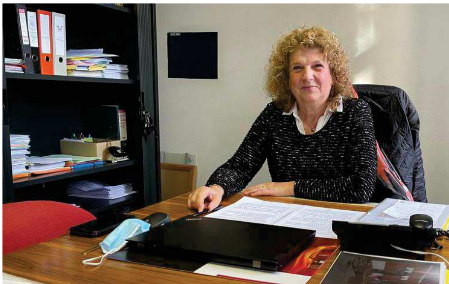
« Ces trois premières années ne ressemblent en rien au précédent mandat. »

« C'est en tout cas notre volonté et je l'espère avant